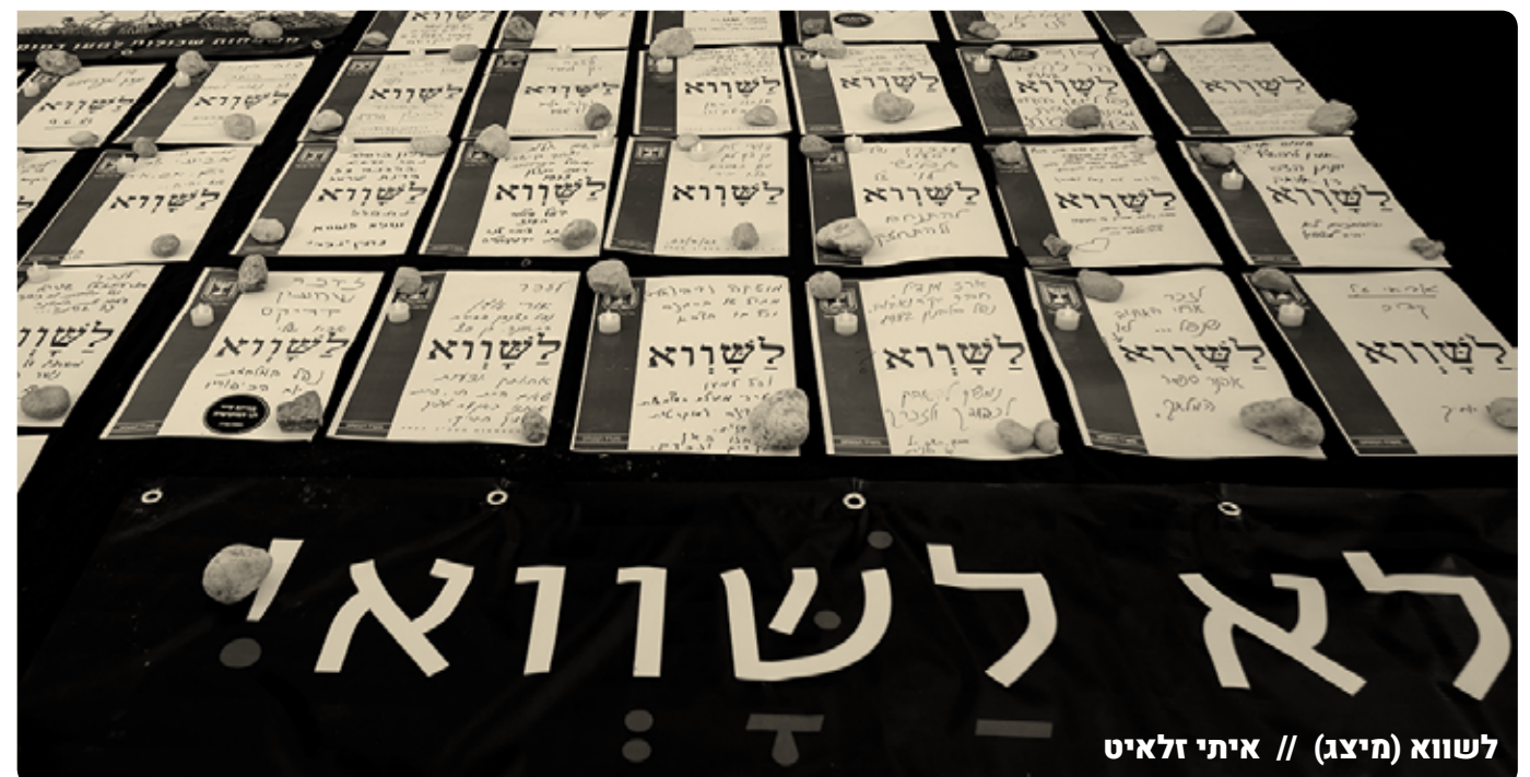
לשווא (מיצג) // איתי זלאיט