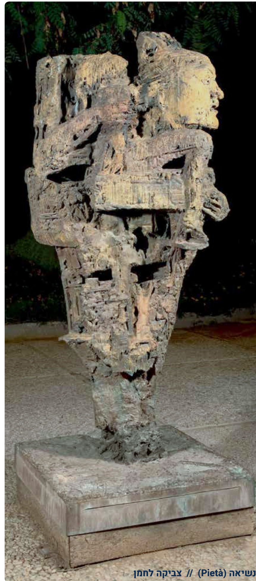
נשיאה (Pietà) // צביקה לחמן