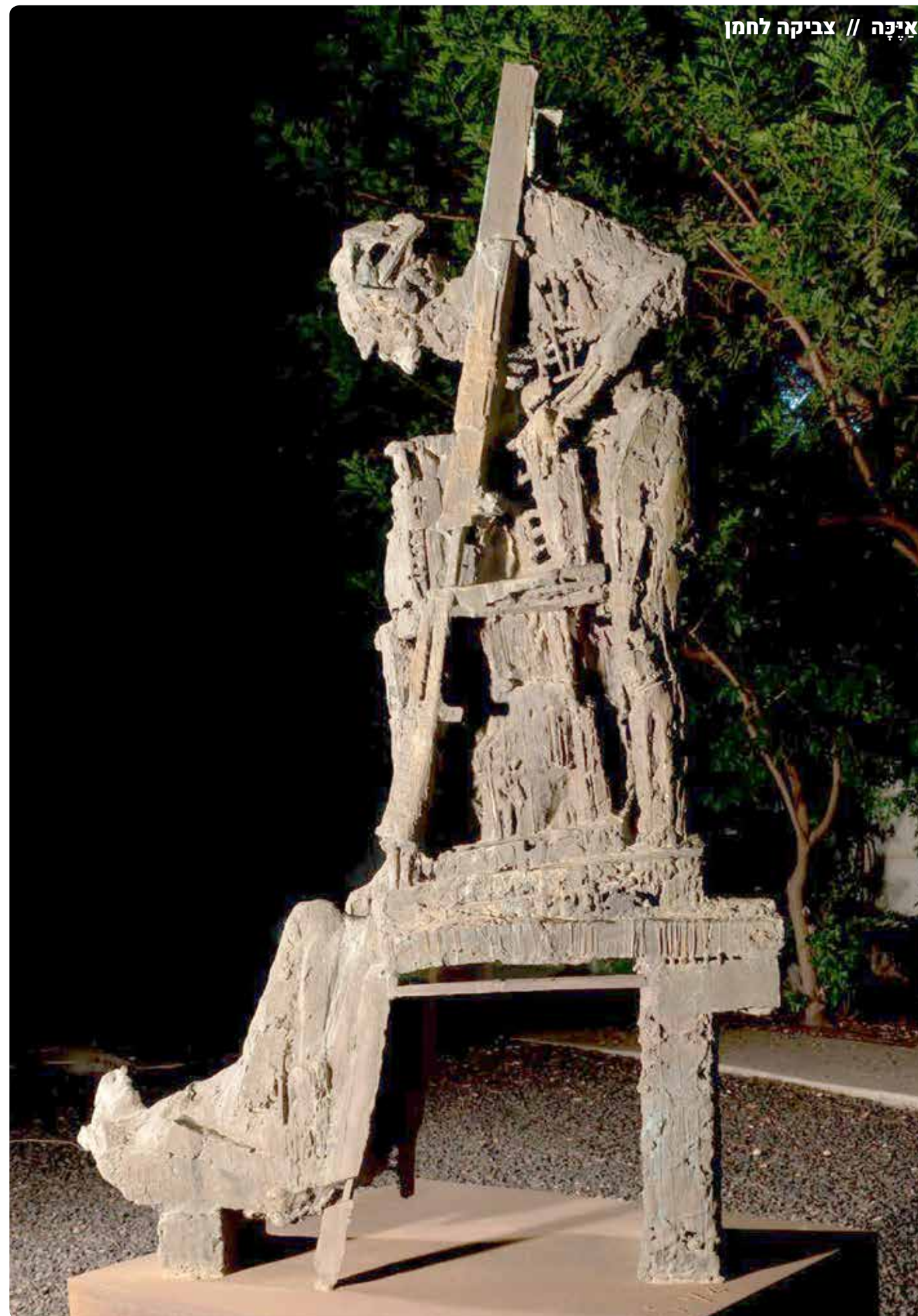
"אין דמוקרטיה ניתנת למדינה על מגש של כסף"

מהר משה, צִיָּה פרעה: "שלח נא את עמי!" מְצֹנֹת האל אמור נא לו: "שלח נא את עמי!" קומה, לך נא, אל כְּבֹד הַלֵּב הרע צו לו, בשמי: "שלח נא את עמי!"