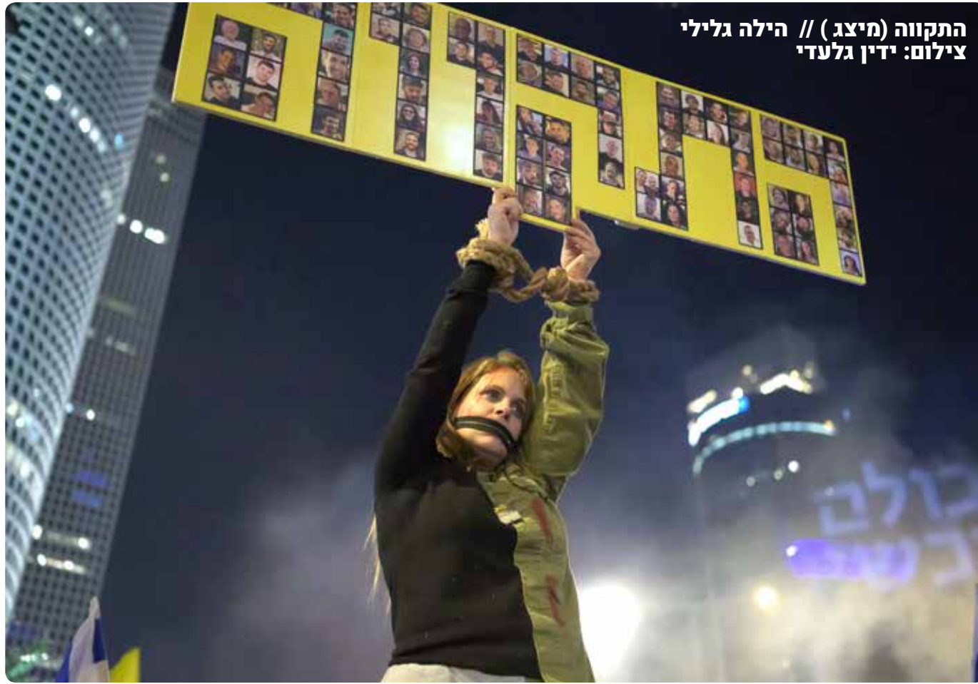
התקווה (מיצג) // הילה גילי