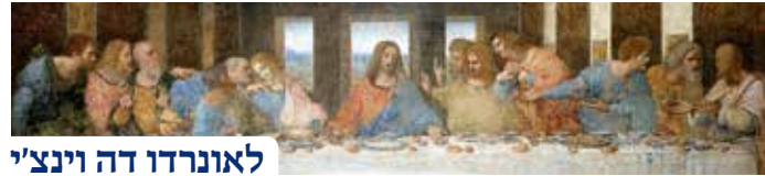
לאונרדו דה וינצ'י

התיאור הקדום ביותר של סדר פסח מוכר מאז, גם אם רובנו לא חשבנו על כך... הברית החדשה מספרת על ישוע ותלמידיו שהכינו את הפסח והסבו לסעודת הסדר אותה ערך ישוע. כולם רחצו ידיים כמנהג "רחץ" (הטובל איתי את ידו בקערה זה יסגירני", אומר ישוע), עורך הסדר בצע את לחם הפסח ("יחץ") וחילקו למסובים ("קחו ואיכלו, זה גופי"), וברך על הכוס ("זה דמי"). הם סיימו בשירת מזמורי תהלים ("הללו") בטרם יצאו אל גת-שמנא שבהר הזיתים, שם התפלל ישוע בעוד תלמידיו נרדמים, ולאחר מכן הוסגר ונעצר. כל זאת, כמתואר בבשורות על פי מתי (כ"ו), מרקוס (י"ד), לוקס (כ"ב - שם מתוארת גם הברכה על כוס ראשונה). סעודה זו של