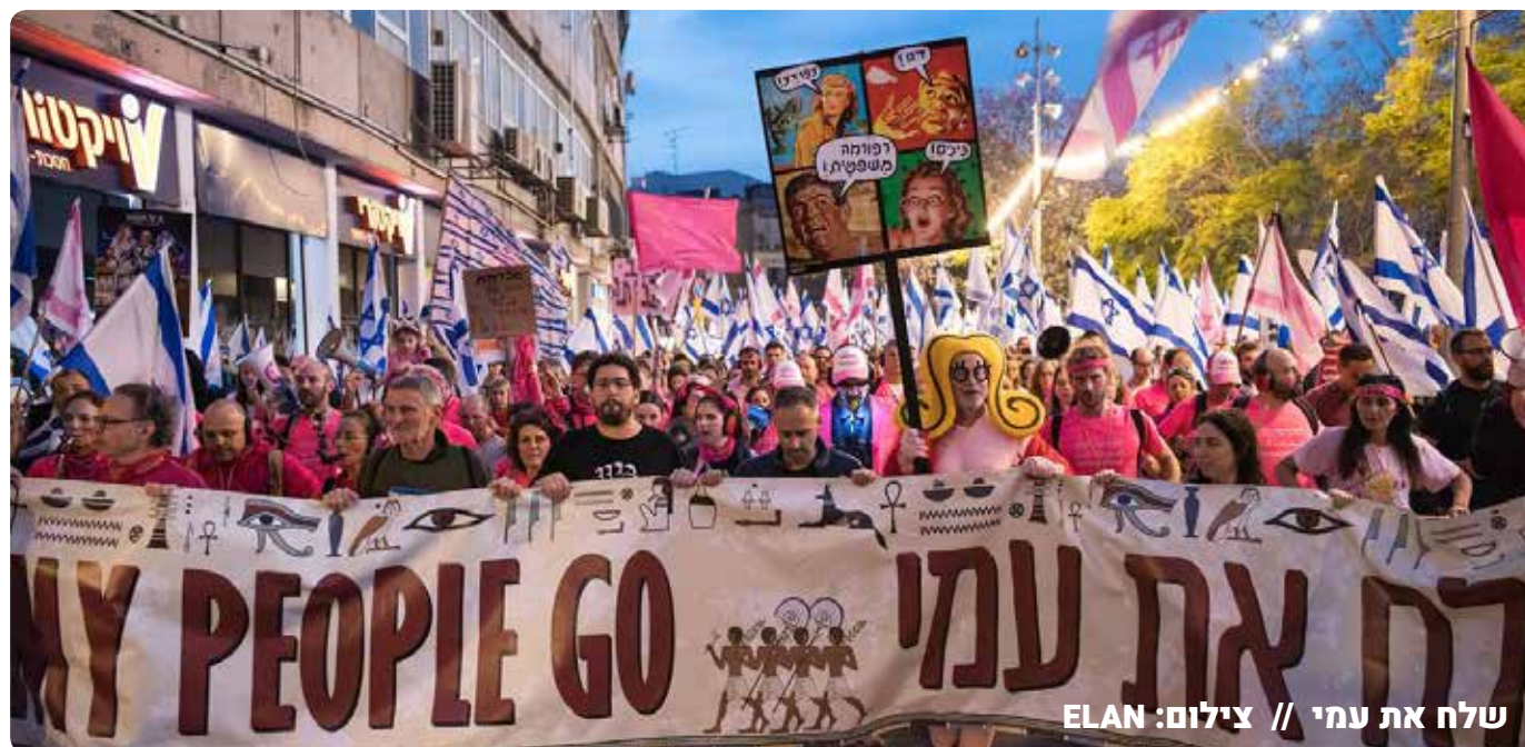
שלח את עמי