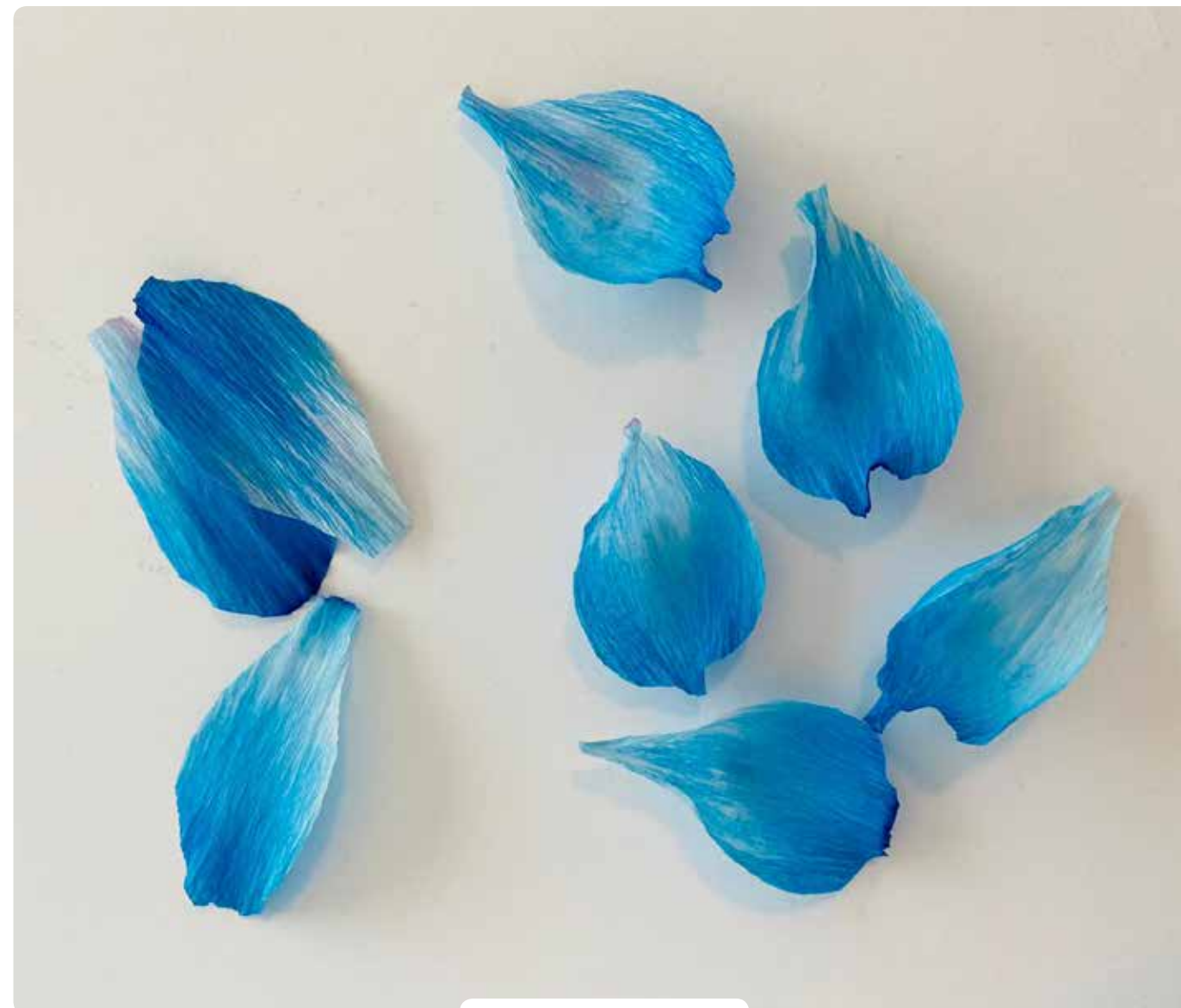
אביב // איריס זהר

2. כל מילה מסמנת את אחת מפעולות עריכת הסדר, כפי שנבצען להלן, והחרוזים נועדו להקל על הזכירה. סימני הסדר סודרו בחרוזים החל מהמאה ה-11 לספה"נ, ונוסח זה (שאינו הקדום ביותר) הוא שנתקבל בסופו של דבר על כל העדות.