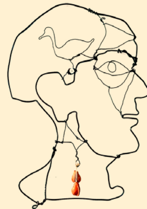
דימוי: יורם אפק

ציון, בראשית מכתבי ציון, הלא אשאל לשלומך, תשאלי לשלומי? איך את מרגישה אני לא מרגישה הכל בסדר? כליך טוב ומה שלום אסיריך? יד ימין שלי פלשתינה יהודיך מתיבשת, תגידי, איך הילדים? העצב דלוק ומה שלום אל תשאלי מחריביך, ציון?