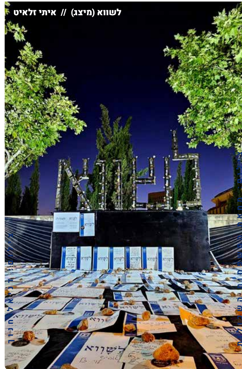
לשווא (מיצג) // איתי זלאיט