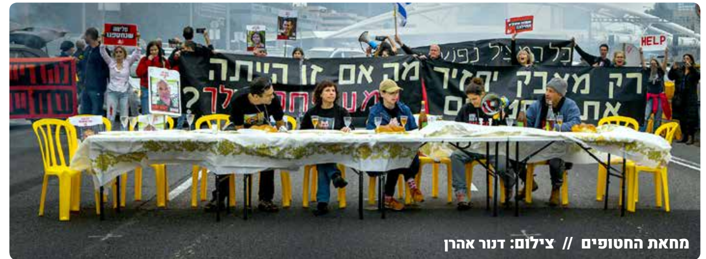
מחאת החטופים