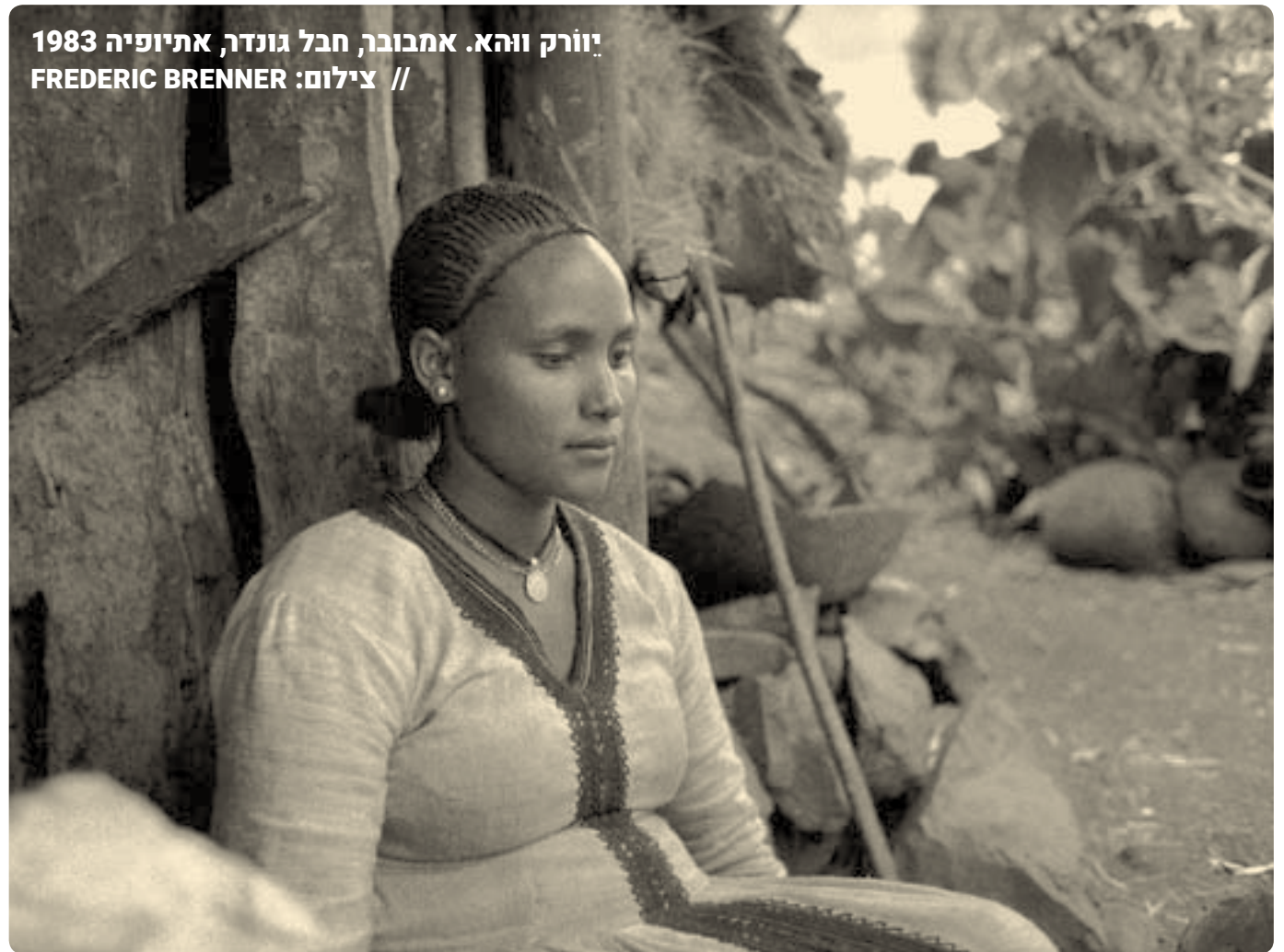
יורק והא. אמבובר, חבל גונדר, אתיופיה 1983

שובי שובי השונמית קומי צאי, יפה כמלכת שבא, קומי צאי, שובי בואי אל ארץ המוריה. חגרי בנה אל גבה, ואלנו נראה לך העולות והשלמים. ושלמה לא ממתין באפריון, ארבה הדרך מלכה יחפה, מזבח כחל-לבן שם עכשו, מרמות אתיופיה המנמנת ואלהים כחל-לבן אל תחתיות ארץ ישראל, ואל תשאלי איה השנה ואין מלאך בדרך ולא שרף, לא עמוד ולא עשן.