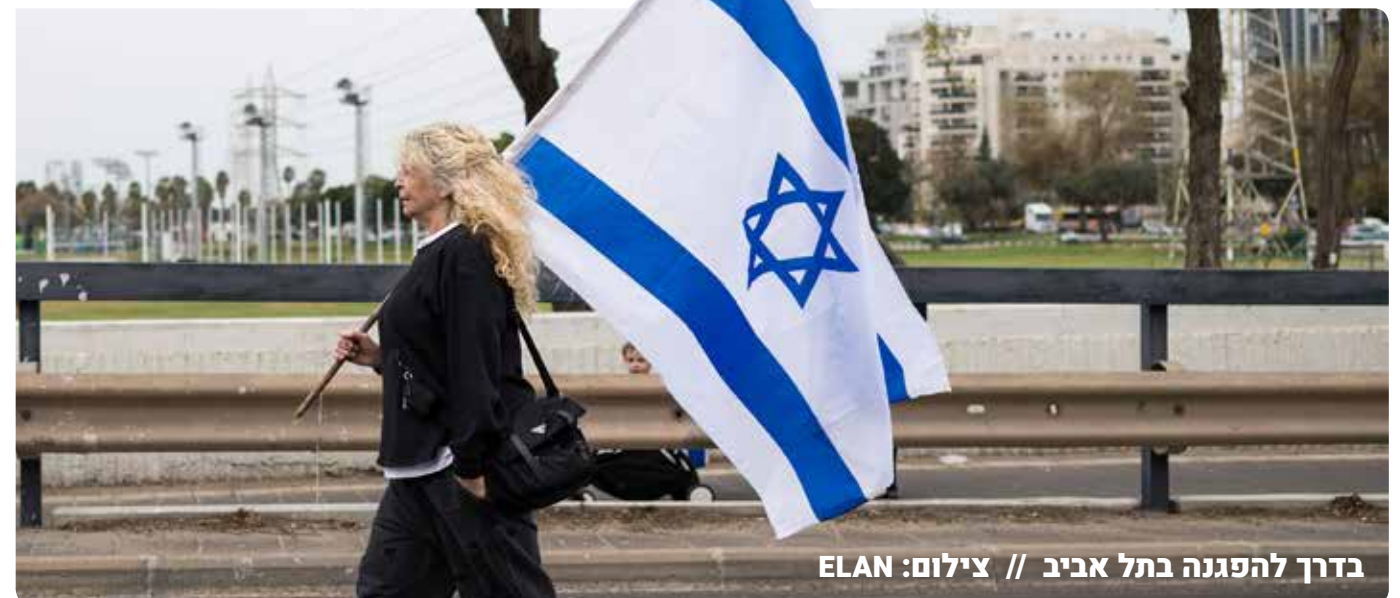
בדרך להפגנה בתל אביב