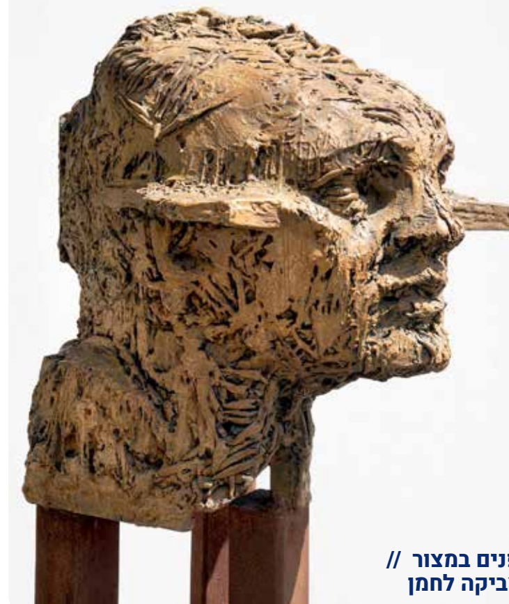
פנים במצור // צביקה לחמן

משוער שזו ההגיה הנכונה של שם אלוהי ישראל, עוד לפני הופעת היהדות בשלהי ימי בית ראשון. משמעותו האפשרית: "זה אשר גורם לדברים להיות". עם זאת יש גם הצעות אחרות, כגון yahwo או yaho, yaw, במשמעות של "להופיע" או משמעות אחרת. בכל מקרה נראה שאין שחר לקריאה לפי ניקוד המסורה: "יְהוָה", וייתכן כי ניקוד זה נועד בכוונה לטשטש את ההגיה הנכונה. אם קריאת השם פוגעת במישהו/י, ניתן לקרוא "אדוני", או כל שם נרדף אחר.