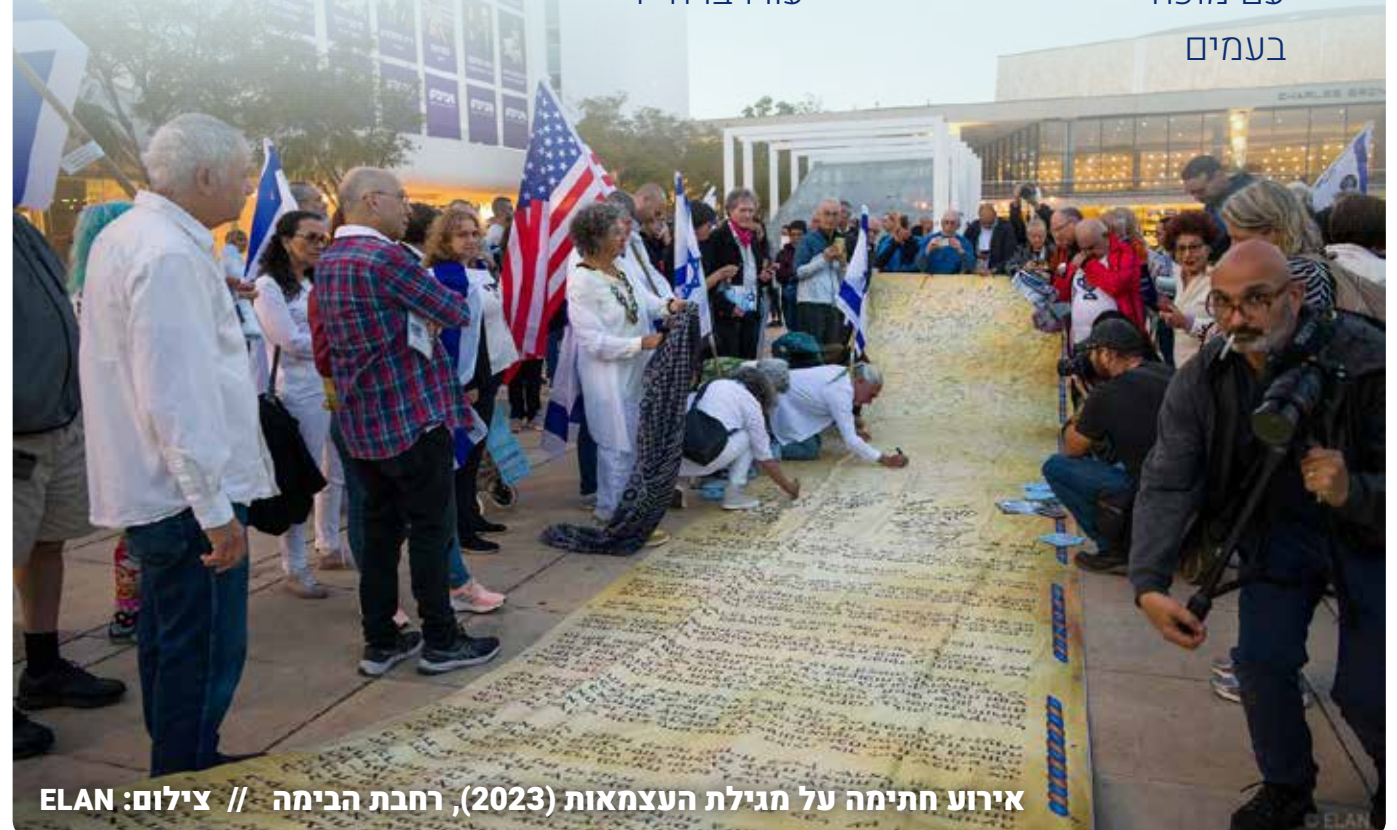
אירוע חתימה על מגילת העצמאות (2023), רחבת הבימה

מאפרו הוא קם עם הסבל לא אֵל המוכה בעמים עם הספר לא מלך עם קדומים הנבחר לא מנהיג קם מתנער משחץ מנהיגיו לא שר מזוהמת ימים נותר ולא רב של רהב ומירמה עפר ואפר ישיבו לו את חייו הונאה ותעתוע לא אֵל לעם המתבוסס העם חוזר לא מלך בים דמיו בלב קרוע לא מנהיג לא מדגל מתנוסס ומגלה לא שר ידלה כוחו את עוצמתו ולא רב לא מרהב ואת כוחו יביאו לו מזור לשונות שריו ידלה ויעלה את כוחו הוא יאזור פצוע ומדמם מדם חייו מתוך הלהט העם דולה כוחו מעומק נשמתו הבוער בעצמיו מתוך קרביו מתוך פצעיו עם קדומים ייעורו בו חייו עם מוכה בעמים