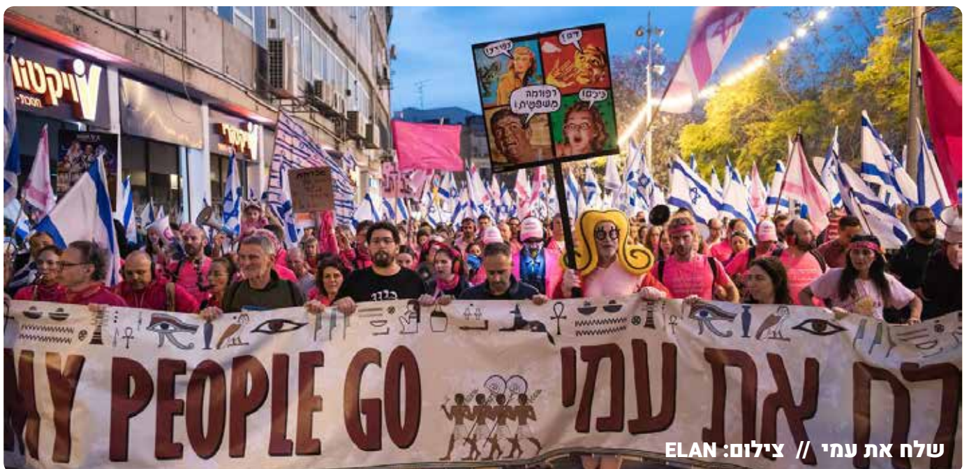
שלח את עמי