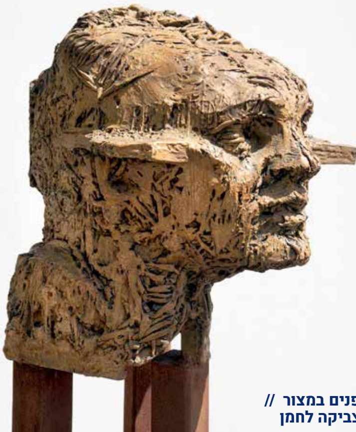
פנים במצור // צביקה לחמן

בכל מקרה נראה שאין שחר לקריאה לפי ניקוד המסורה: "יְהוָה", וייתכן כי ניקוד זה נועד בכוונה לטשטש את ההגיה הנכונה. אם קריאת השם פוגעת במישהו/י, ניתן לקרוא "אדוני", או כל שם נרדף אחר.